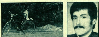
Tatort Langenhorn: Kriminalbeamte haben eine Decke über den Toten gebreitet.