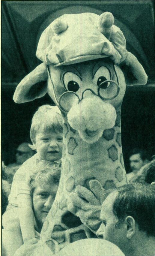
Eine kurzschichtige Plüschgiraffe mit einem fast endlos scheinenden Hals tanzte zur Blasmusik. Sehr zur Freude der Kinder, die das 2,50 Meter große Wesen bestaunten.